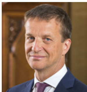
Ardo Hansson Eesti Panga president