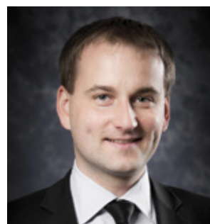
Mart Mere Marsh Kindlustusmaakler AS juhatuse esimees