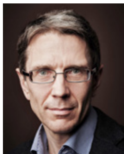
Tõnu Mertsina Swedbanki peaökonomist